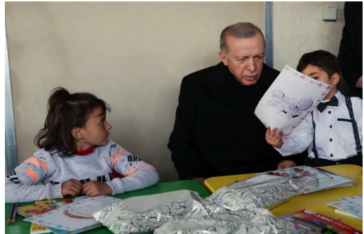
صورة رقم (9) ورقم (10) تظهرا التركيز على الرئيس التركي رجب طيب أردوغان وتأييد الشعب التركي له، حيث حرصت الصور على تقديمه وسط شعبه ووسط الأطفال الذين عانوا بسبب أحداث الزلزال وعلى اليمين صورة توضح ترحيب الشعب أو الجمهور به ولا يظهر سواه في الصورة واضعاً يديه على صدره في تعبير عن امتنانه لجمهوره