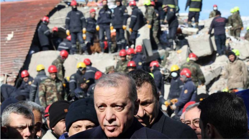
صورة رقم (8): ذات زاوية مرتفعة تركز على رجب طيب أردوغان وفي الخلفية صور المواطنين ورجال الإنقاذ والدمار في كل مكان كدليل على حجم المأساة التي أصابت تركيا وأن رجب طيب أردوغان قائد يظهر في المقدمة وخلفه الناس