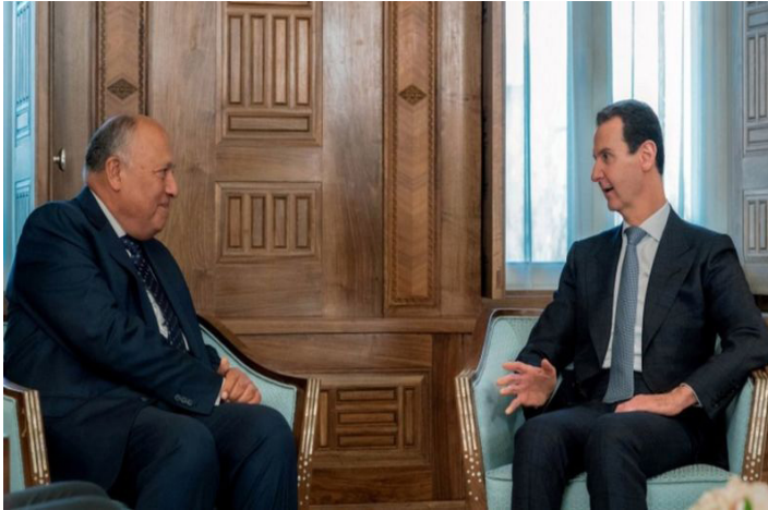
صورة رقم (7): تُظهر التقارب المصري السوري، حيث تجمع الصورة بين بشار الأسد الرئيس السوري والسيد سامح شكري وزير الخارجية المصري وذلك بعد سنوات من انقطاع وبرود العلاقات بين الجانبين