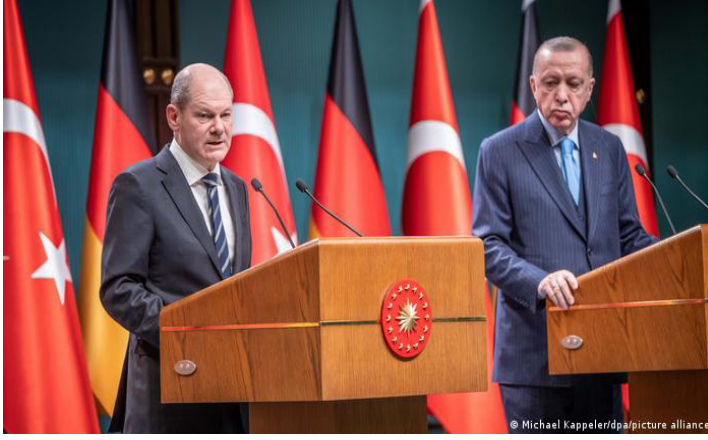
صورة رقم (6): تعرض جهود الرئيس رجب طيب أردوغان من خلال محادثاته مع الدول المختلفة لمساندته في جهود الإنقاذ