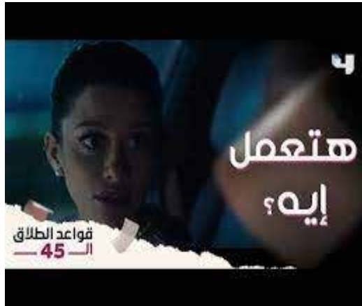
الشكل رقم (6) يوضح قيمة التحرر وبعض القيم المستجدة