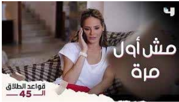
الشكل رقم (3) يوضح قيمة تقديم مصلحة الأسرة على الفرد