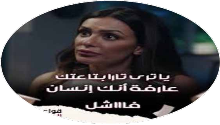
الشكل رقم (5) يوضح قيمة الذكورية، والأنانية