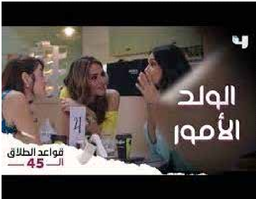
الشكل رقم ( 4 ) يوضح قيمة التحرر